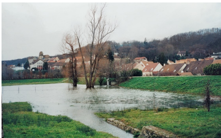
Bassin d'expansion de crue, assurant un stockage de l'eau et retardant son écoulement vers l'aval

Pour le bassin des Sablons-Petites Caves (22000 m 3 ), la Déclaration d'Utilité Publique du 7 décembre 1981 pour l'acquisition par voie d'expropriation des terrains agricoles appartenant à 13 propriétaires, est suivie par l'Enquête Hydraulique du 14 octobre au 10 novembre 1983.