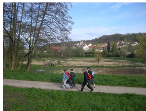
Circuit de promenade autour du bassin de retenue