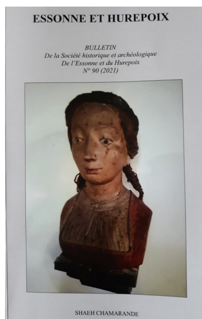
Sainte Ténestine, bois peint du XVIIIe siècle, église de Vauhallan