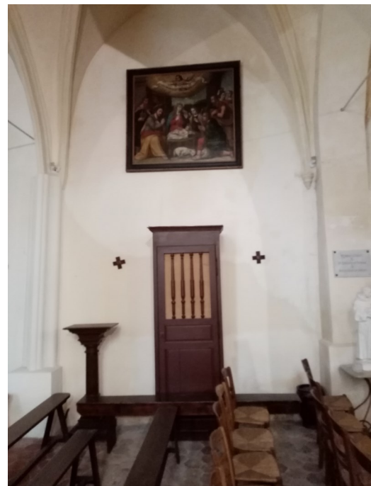
Nouvelle armoire avec la porte (MH) de l'ex confessionnal