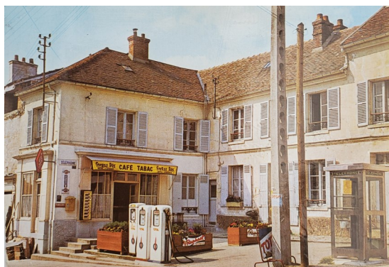
Dernières pompes à essence de Titine . Oblitération 1973.