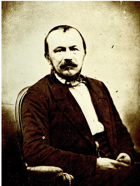
Gérard de Nerval (1808-1855) Poète et écrivain célèbre, ami intime de Nadar; il se suicida Le critique Albert Béguin dit de cette photo qu'elle était "le portrait le plus révélateur d'un homme qu'une chambre obscure ait jamais emprisonné dans sa nuit" (1855)

Extrait de: "les grands maîtres de la photo" n°5 NADAR