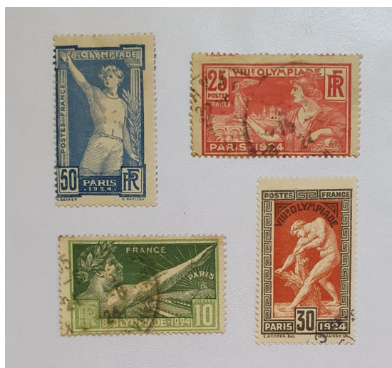
Timbres JO 1924 Collection RD